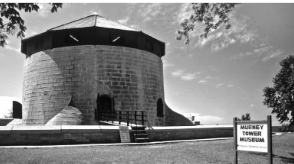
Tour Murney, Parcs Canada

Les ressources archéologiques recensées comprennent les fondations de divers bâtiments, les couches d'occupation associées aux tours et le batardeau entourant la tour Shoal. Il est très probable que d'autres caractéristiques archéologiques se trouvent près des tours Murney et Cathcart et du fort Frederick. La collection d'objets historiques meubles comprend du matériel militaire original divers situé dans les tours et entreposé ailleurs.