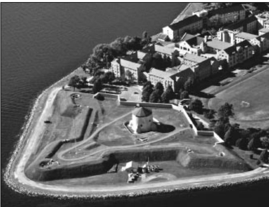
Vue aérienne du fort Frederick