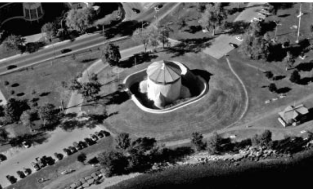
Vue aérienne de la tour Murney, Parcs Canada