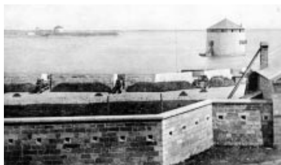
Carte postale montrant la tour Shoal et la batterie du marché, vers 1870.

Au milieu des années 1840, les tensions anglo-américaines atteignent un point critique concernant la frontière de l'Orégon, et la menace d'une guerre avec les États-Unis force les autorités de la colonie à renforcer à nouveau le fort Henry. Parallèlement, afin de doter la ville, le canal et les arsenaux maritimes d'un système de défense plus complet, les Britanniques construisent le fort Frederick et la batterie du marché (l'actuel site du parc de la Confédération en face de l'hôtel de ville de Kingston) ainsi que les tours Martello Shoal, Murney et Cathcart.