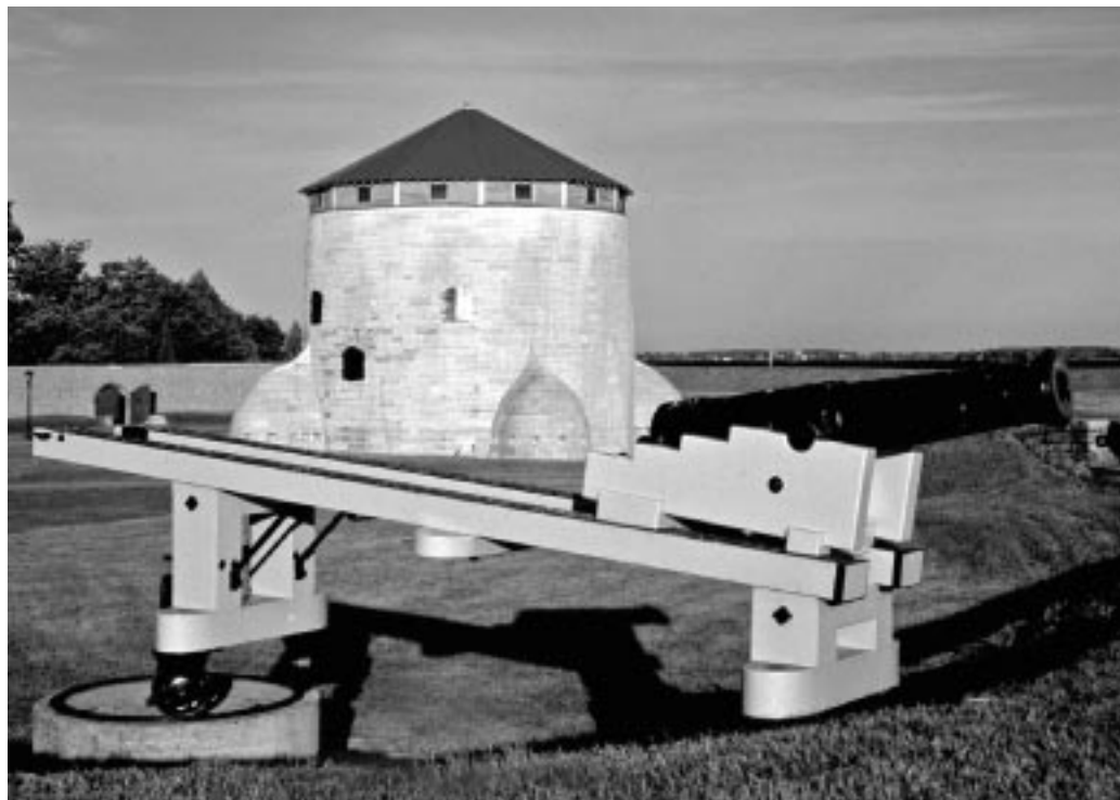
Fort Frederick, Parcs Canada

L'intégrité commémorative des fortifications de Kingston sera assurée en premier lieu si l'on assure la protection et la conservation des précieuses ressources culturelles du lieu et en deuxième lieu si l'on veille à ce que les Canadiens et les visiteurs étrangers comprennent pourquoi le réseau de fortifications revêt une importance historique nationale.