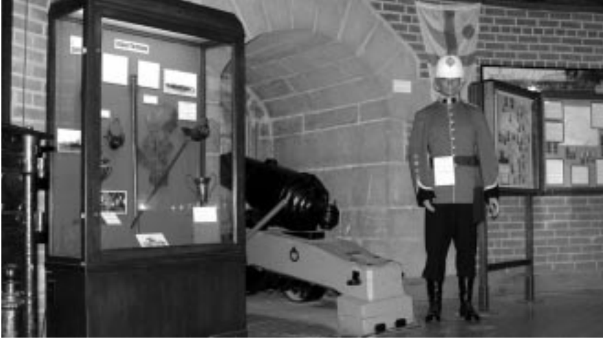
Musée du Royal Military College of Canada.