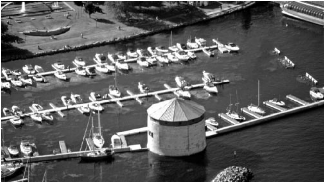
Vue aérienne de la tour Shoal, Parcs Canada