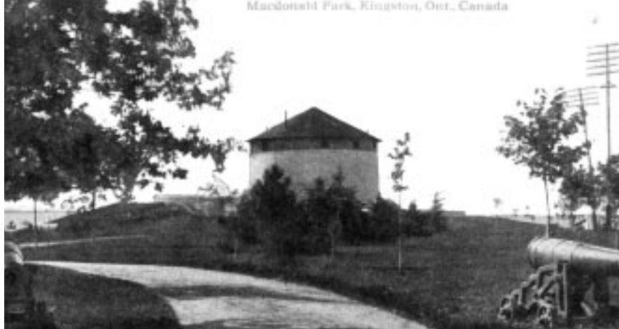
Tour Murney, vers 1905