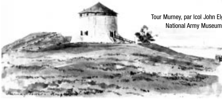
Tour Murney, par Icol John Elgee, vers 1865, National Army Museum, Londres