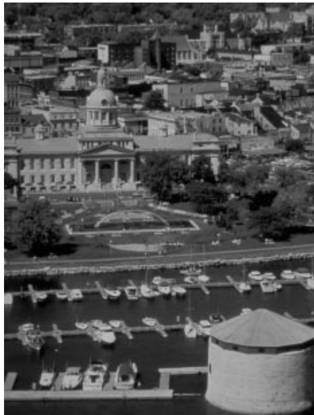
Vue aérienne de la tour Shoal et de l'hôtel de ville de Kingston

Le plan directeur sera présenté au ministre de l'Environnement pour approbation et, une fois approuvé, sera déposé au Parlement puis distribué au public.