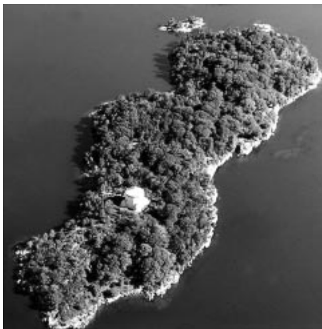
Vue aérienne de la tour Cathcart sur l'île Cedar, Parcs Canada