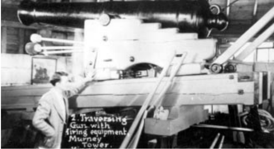
Tour Murney, 1938