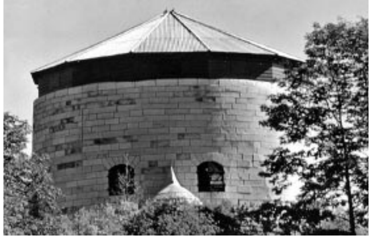
Tour Cathcart, Parcs Canada

Les fortifications de Kingston n'ont jamais subi l'épreuve de la guerre et, quelques années après leur construction, la capacité défensive de ces importantes structures devient inutile avec l'arrivée d'une artillerie améliorée. Dès 1870, la garnison britannique quitte l'endroit définitivement, les fortifications étant désormais confiées à la toute nouvelle armée canadienne qui s'en sert pour entraîner ses troupes ou pour entreposer de la marchandise.